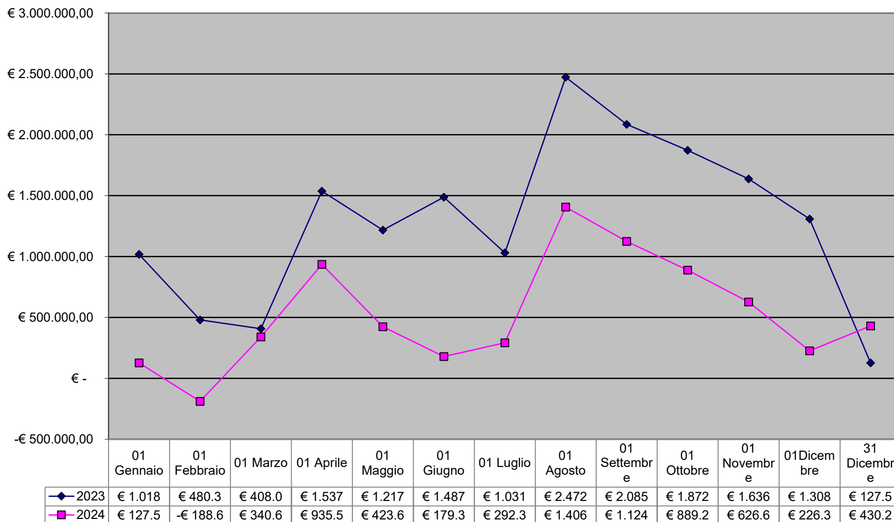
Tabella n° 2 - Andamento finanziario bancario del 2024 (rosso) e del 2023 (nero) (in migliaia)